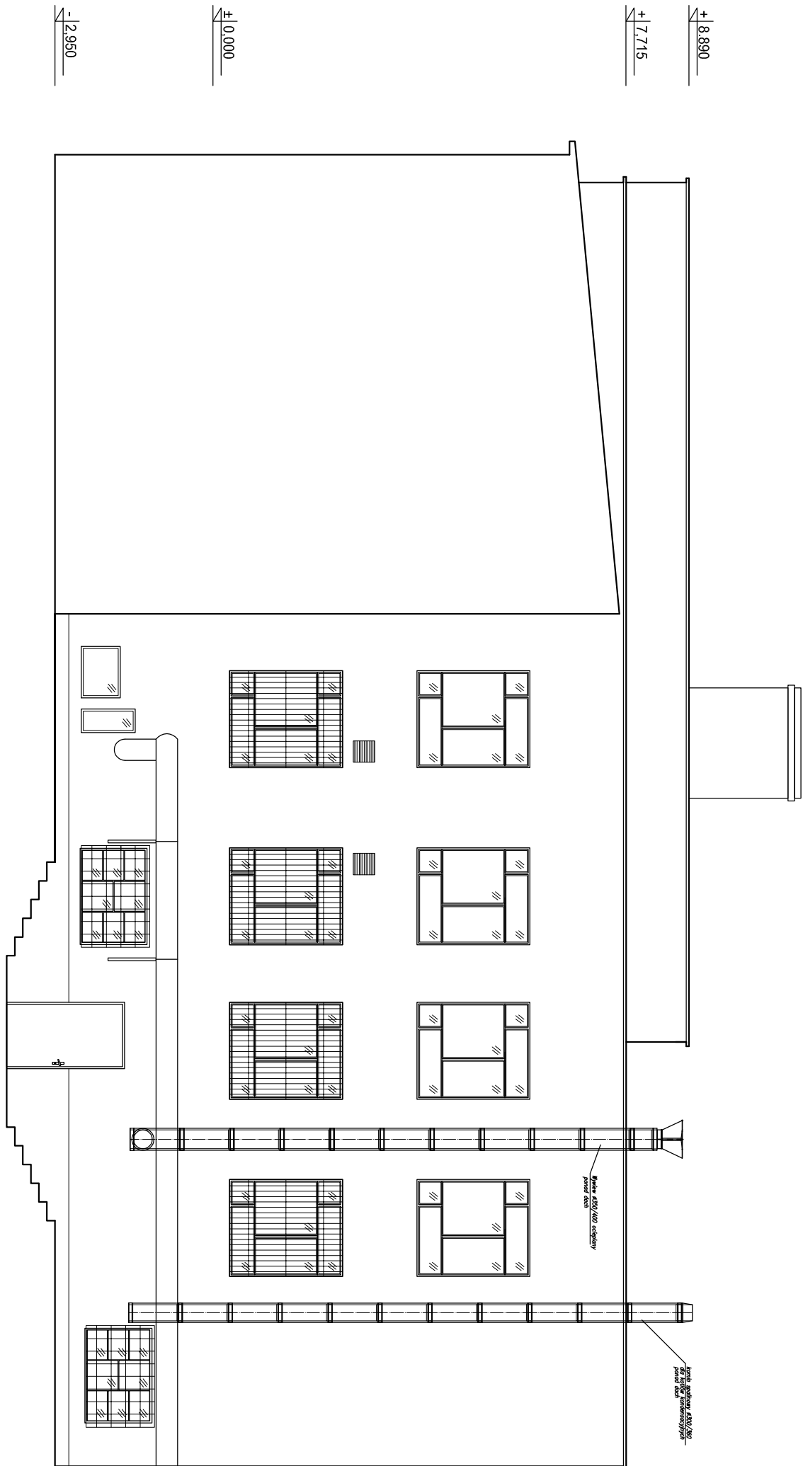
ELEWACJA PÓŁNOCNO - WSCHODNIA